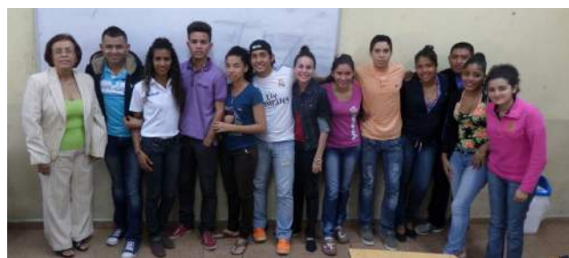
Grupos de estudiantes de la Escuela de Periodismo en sus respectivos años académicos. I, II, III y IV.