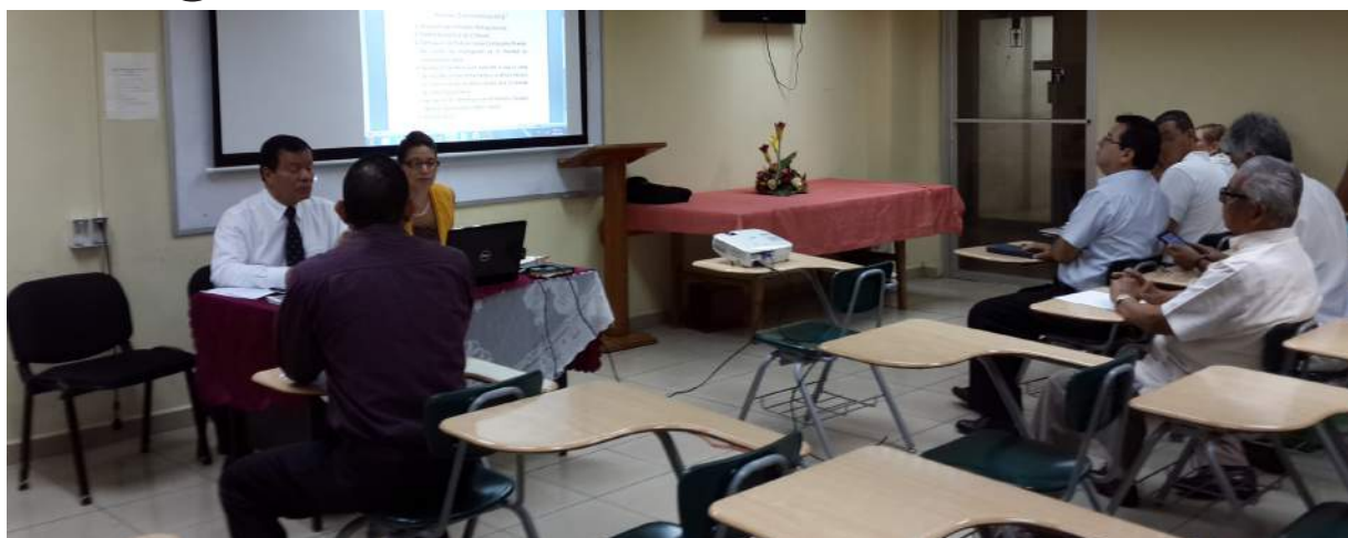
Reunión de Junta de Facultad 10 de diciembre de 2014.

El Decano asistió al XIV Congreso Internacional de Relaciones Públicas y Comunicación, realizado del 21 al 23 de octubre en Salvador Bahía, Bra-