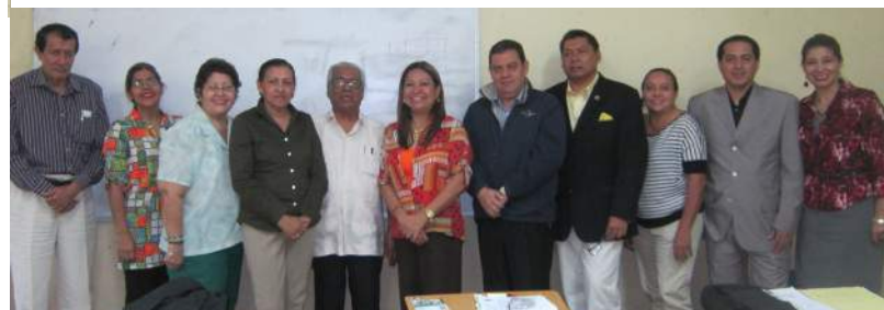
Docentes del Departamento Fundamentos de la Comunicación en reunión de evaluación y coordinación.