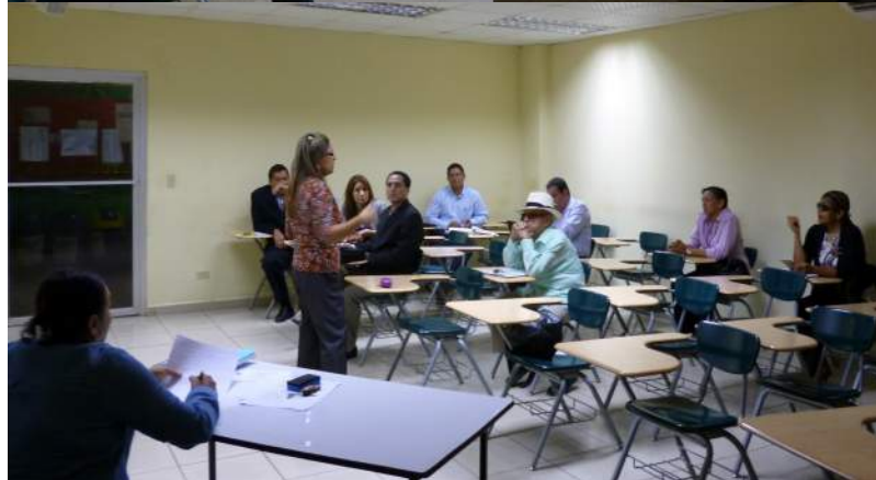
La Facultad trabaja con los departamentos, escuelas y comisiones de trabajo, en la planificación y organización de las actividades académicas, de extensión e investigación. Cada docente reconoce el trabajo y compromiso con la unidad académica y la Universidad con miras a la autoevaluación y acreditación de las carreras.