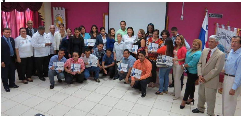
Reconocimiento a profesionales egresados de la Escuela de Periodismo de la Facultad de Comunicación Social de la Universidad Autónoma de Chiriquí

El 12 de noviembre dentro del marco de la Semana de la Comunicación, las autoridades de la Facultad de Comunicación Social hizo un reconocimiento a los periodistas en ejercicio, egresados de la UNACHI.