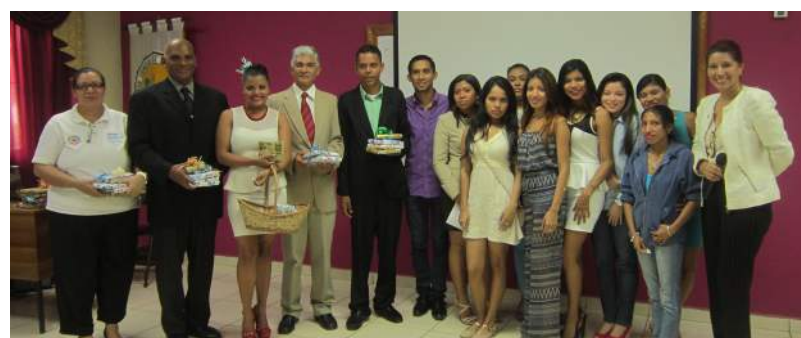
Docentes de la Escuela de Periodismo con estudiantes de III año

Las comunicaciones sociales destacadas como un campo de estudio interdisciplinario y dedicado a la investigación y expresión en los diferentes medios masivos, en donde el comunicador lleva la información y es la voz de todo un pueblo de la manera más objetiva posible.