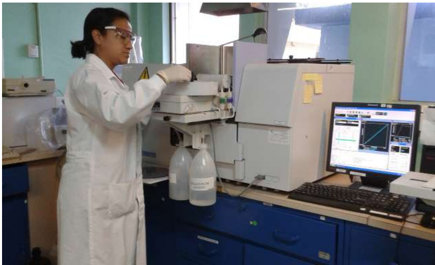
Personal del Laboratorio