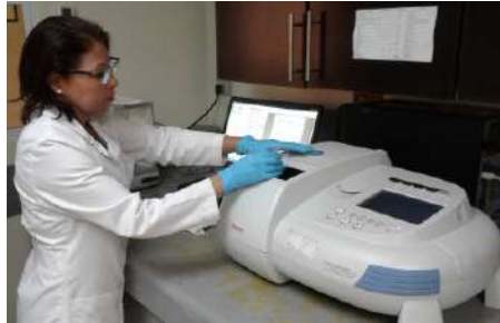
Análisis con Espectrometría molecular