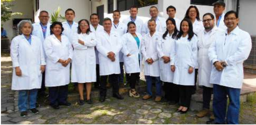
Personal del Laboratorio