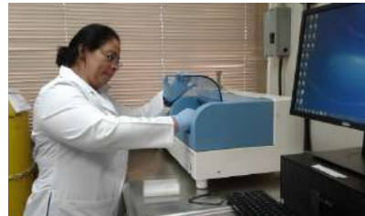
Análisis Directo de Mercurio