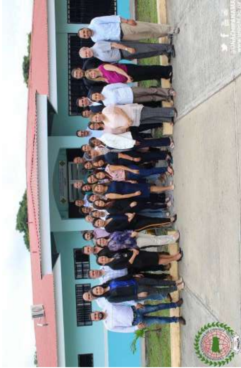
Asistentes al Encuentro Internacional de Laboratorios de Aguas Residuales. UNACHI 2018