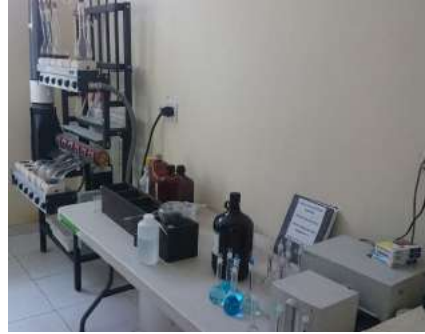
Digestor de Nitrógeno