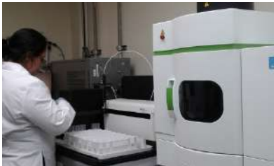
Análisis de Metales Pesados con Espectrometría