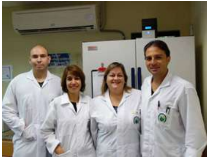
Personal del Laboratorio