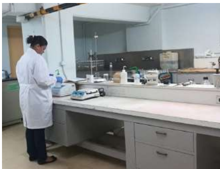
Personal en el laboratorio