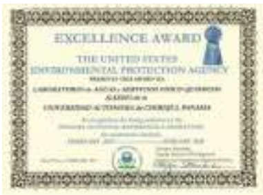
Figura 4. Reconocimiento como laboratorio referente para análisis de aguas residuales de la República de Panamá.