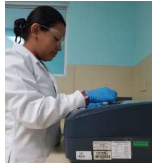
Figura 3. Analista utilizando equipo donado por USAID-EPA