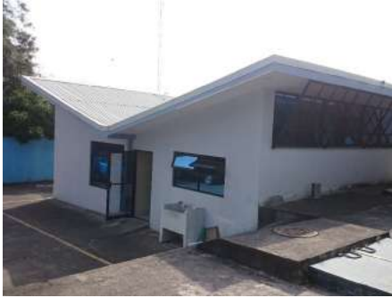
Laboratorio de AR