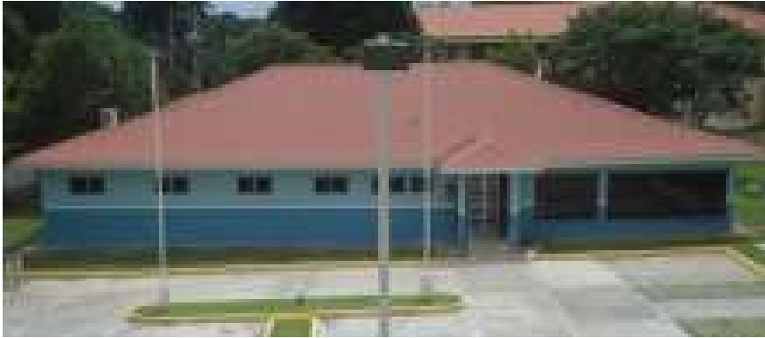
Figura 1. Instalaciones del Laboratorio de Aguas y Servicios Físicoquímicos