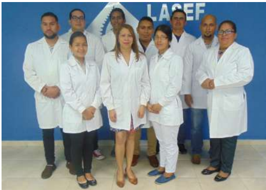
Figura 2. Personal de LASEF