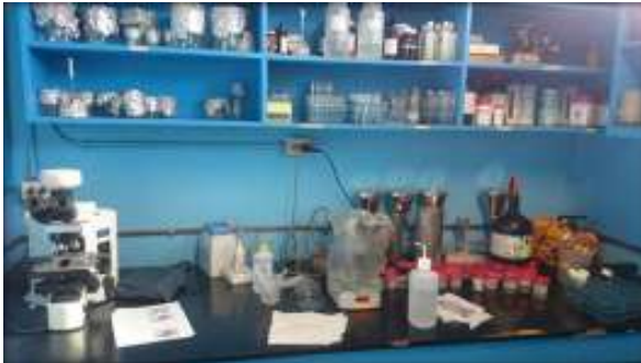
Área de trabajo de Microbiología