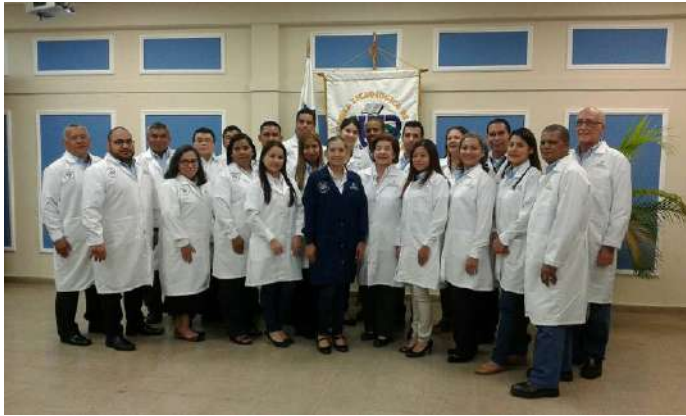
Personal del Laboratorio