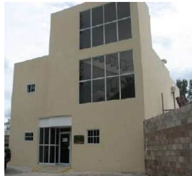
Edificio Laboratorio Calidad de Agua