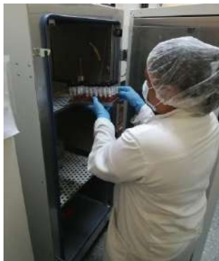
Personal en el laboratorio