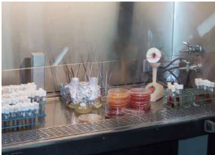
Cámara de flujo laminar