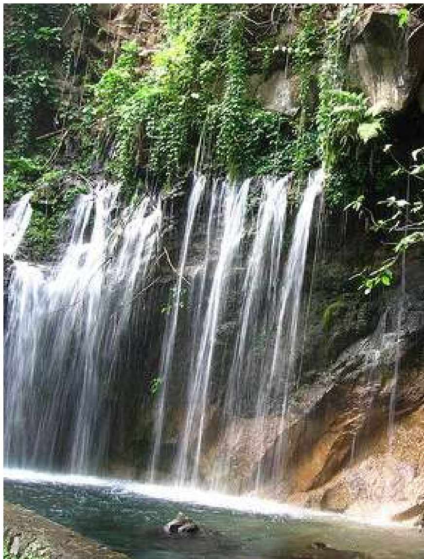
Los Chorros de la Calera, El Salvador