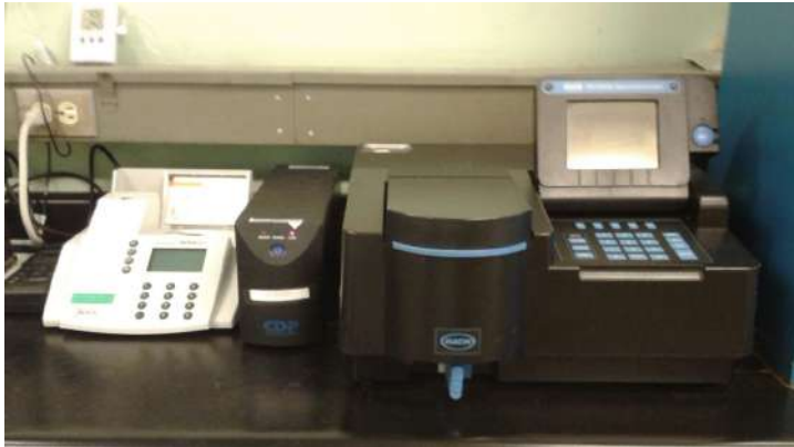
Equipos en el Laboratorio